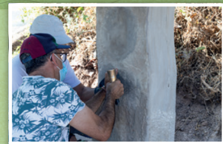
7/14. SAÚL RUIZ 7. Sinuosa II 2016 14. Un alto en el Camino 2021