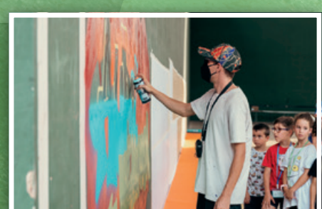
15. RESAKS Cromatismo del Camino 2024