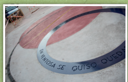
3. TALLER ENBLANCO LaDanza 2018