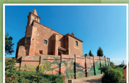
6. CARLOS CORRES Trato vegetal 2020