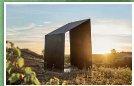
12. BALANZA 0,001366664056 s luz 2020